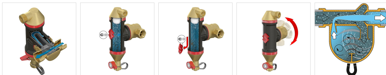
Selection table for Flamcovent & Clean Smart series